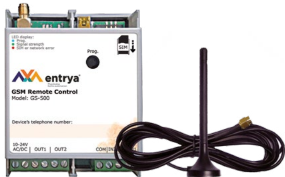
GSM module en antenne

Alle oproepen naar uw GS-500 zijn gratis want de module weigert alle oproepen. U kunt het toestel laten terugbellen om een actie te bevestigen. Gaat u veelvuldig gebruik maken van deze controlefunctie, dan raden wij aan om voor een abonnement te kiezen.